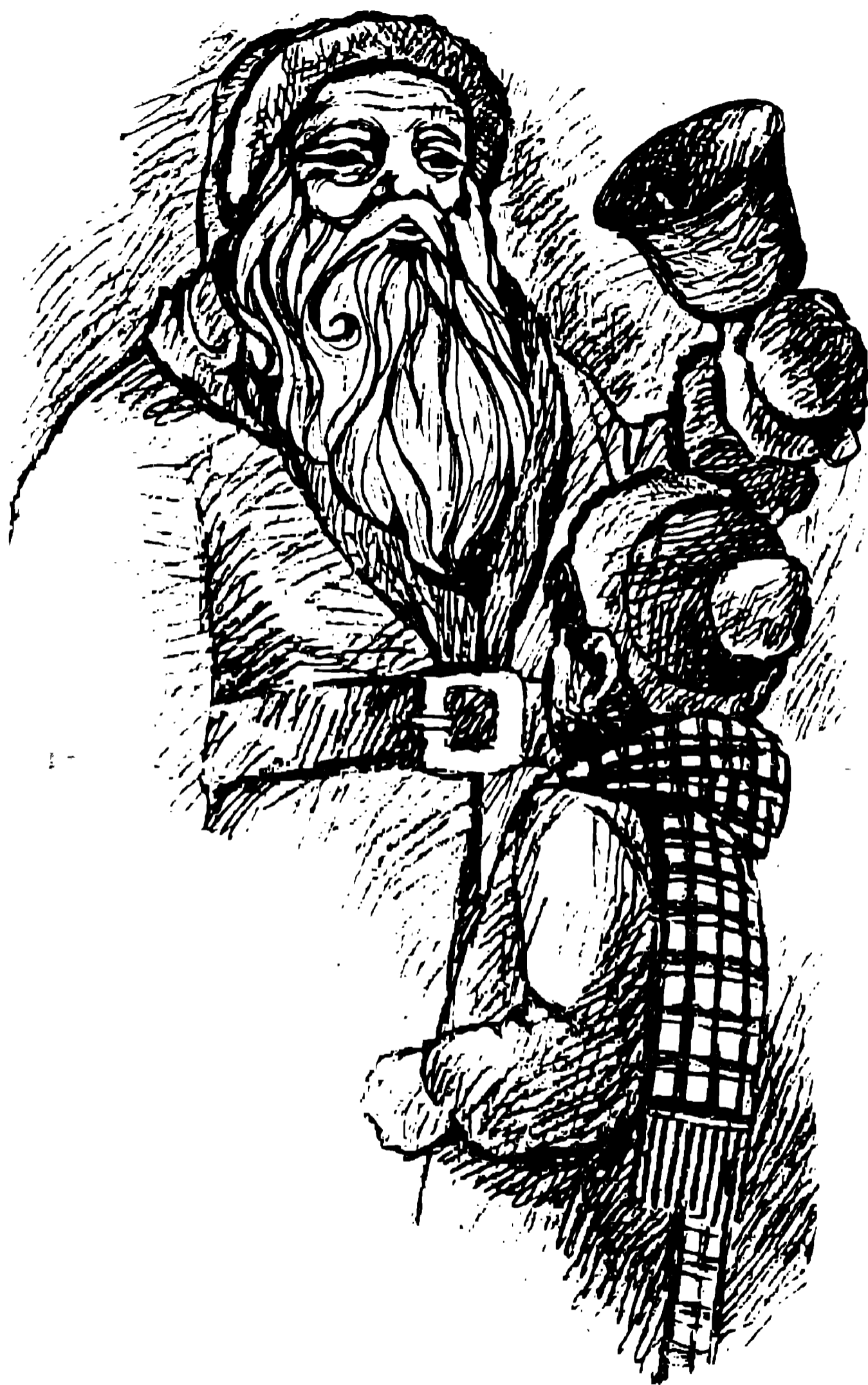
चित्र : सांता क्लॉज उपहारों के साथ